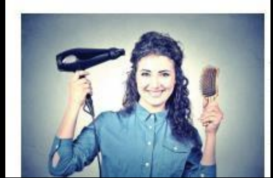
घुँघराले बालों पर ड्रायर चलाना

घुँघराले बालों पर ड्रायर चलाना: इस विधि में ऊँगलियों का उपयोग करके बालों के खंड को उठायें और मुट्ठी में बालों को लेते हुए उसे बांधने के ठीक पहले दूसरे हाथ के माध्यम से बालों को फैला दें। इस प्रक्रिया में मूस की महत्वपूर्ण भूमिका होती है क्योंकि यह बालों को आकार प्रदान करने में सहायक होता है। इसके सिरे को उल्टा करके लगाया जाना चाहिए। इस शैली में घुँघराले बालों को खींचा नहीं जाता है इसलिए स्ट्रेटनिंग से इसमें बचा जाता है।