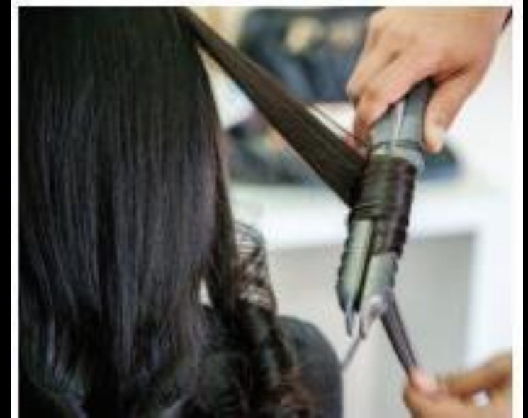
बालों को सीधा करना (स्ट्रेटनिंग)

बालों को सीधा करना (स्ट्रेटनिंग): बालों को सीधा करने के लिए हेयर स्ट्रेटनर एवं ब्लो ड्रायर का प्रयोग किया जाता है। बालों का एक छोटा सा हिस्सा लें इसे प्लेटों के बीच में दबायें और धीरे-धीरे बालों की लंबाई के साथ बालों के अंत तक ले जाएं। बालों को पूर्णतः सीधा करने के लिए इस प्रक्रिया को बालों पर बार-बार दोहरायें। अब बालों का दूसरा हिस्सा लें और उस पर भी यह प्रक्रिया दोहरायें। ब्लो ड्रायर का उपयोग करते हुए बालों को सीधा करते हुए बालों के एक हिस्से को ब्रश पर लें और ब्रश के ऊपर ड्रायर को रखें और लंबाई के साथ आगे बढ़ें। प्रत्येक भाग पर इस प्रक्रिया को दोहरायें और बालों की लंबाई के अंत तक सीधा करें।