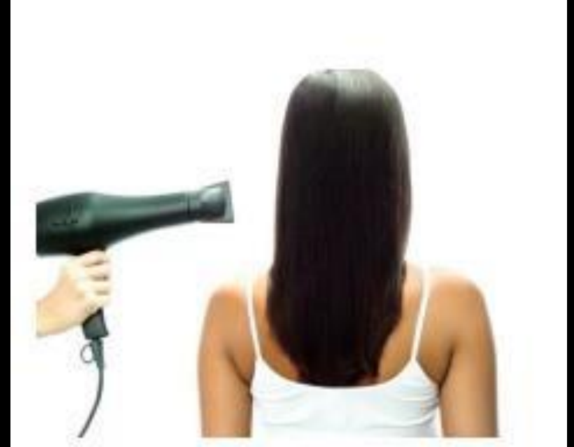
स्मूथ ब्लों ड्राई

स्मूथ ब्लों ड्राई: बालों को फूला हुआ दिखाने के लिए ब्लो ड्राई एक सरल विधि है। यह बालों को मजबूत भी करती है। बालों को दो भागों में विभाजित कर एक भाग को उठाये। बाकी बालों को क्लिप करें और उस सेक्शन पर काम करना शुरू करें। बालों को सीधी तरफ से घुमाते हुए ब्रश में रोल करें और उस पर सीधे हेयर ड्रायर का उपयोग करें। नम बालों पर इस तरह की ब्लों ड्राई करें।