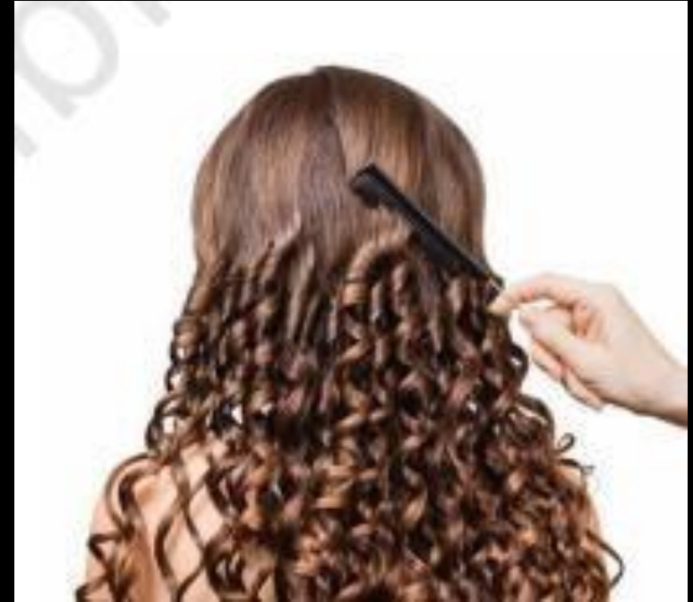
बालों की लट (रिंग लेट्स)

बालों की लट (रिंग लेट्स): यह स्टाइल बिना किसी परेशानी के बालों को एक एलिगेन्ट एवं स्टाइलिश लुक प्रदान करती है। यह लंबे समय तक टिकी रहती है और खास अवसर के लिए यह आकर्षक केश-सज्जा है। इस स्टाइल को कर्लिंग आयरन की मदद से बनाया जा सकता है। (चित्र 3.18) रिंगलेट कई प्रकार के होते हैं जैसे कि क्लीपर, स्पायरल, स्मूथ, सॉफ्ट फ्लफी एवं लेवेल्ड आदि।